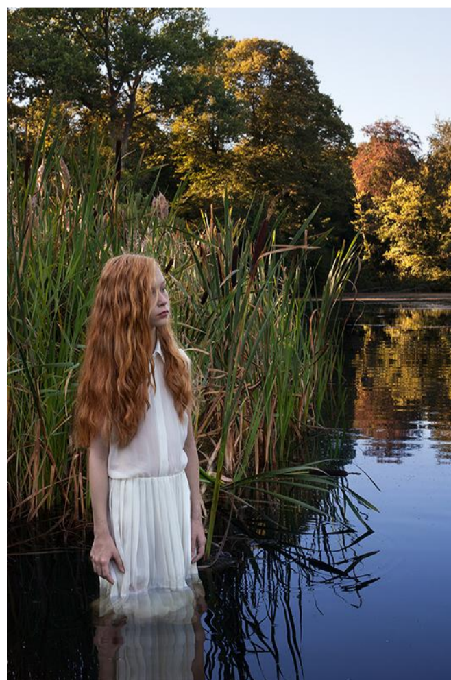
Uit de serie 'Anna en de reis van de zalm'.