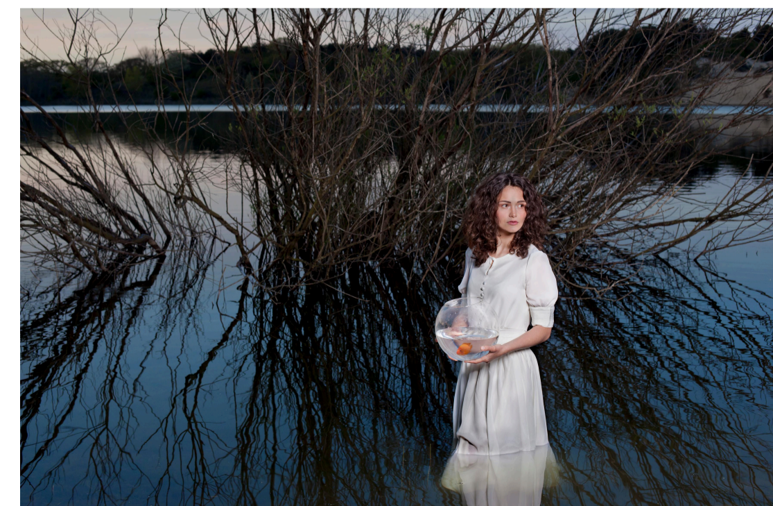
'Anna en de reis van de zalm'.